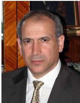
сов академика - история Царского лица и биография Александра Горчакова.